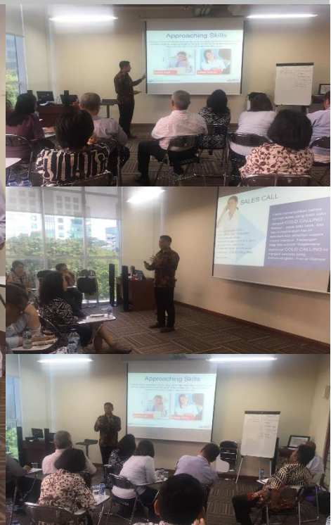
Foto: Peserta training Maximizing Sales Performance, Selasa 11 April 2018, ACA Kemayoran