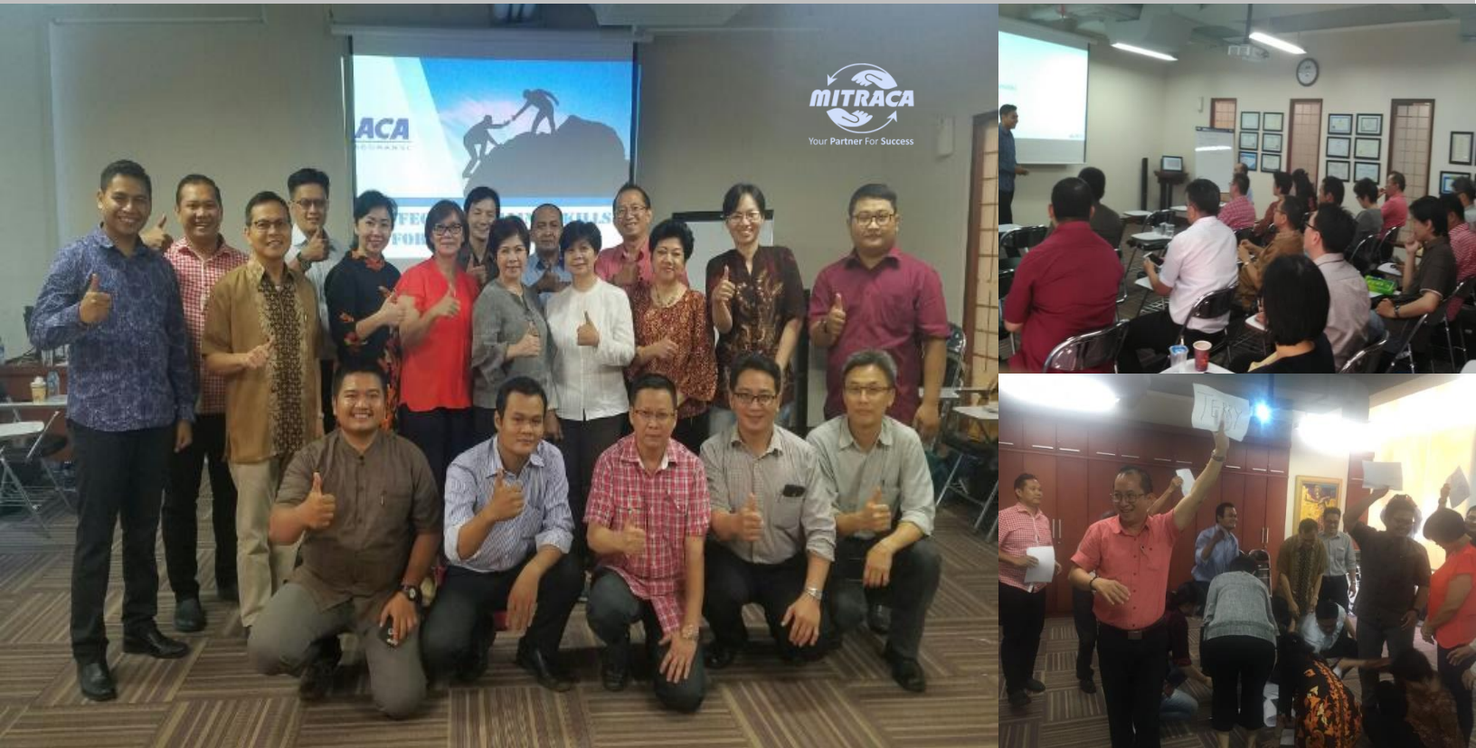
Foto: Peserta training Maximizing Sales Performance Batch II, Senin 30 April 2018, ACA Kemayoran